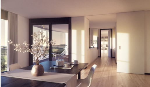
Sunshine Scenery, veduta interna 2*

*Le foto in qualità idonea alla stampa sono disponibili sul nostro sito web e possono essere scaricate sotto il rispettivo comunicato stampa su http://www.hrs.ch/media/comunicati-stampa/ .