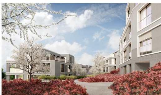
Sunshine Scenery, veduta esterna 3*