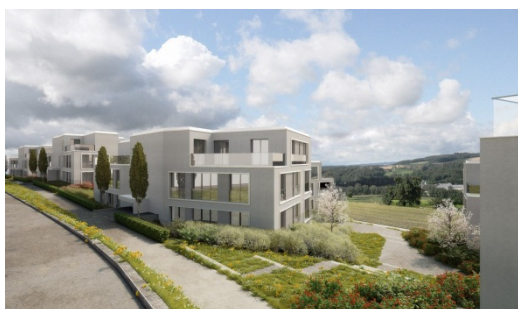
Sunshine Scenery, veduta esterna 2*