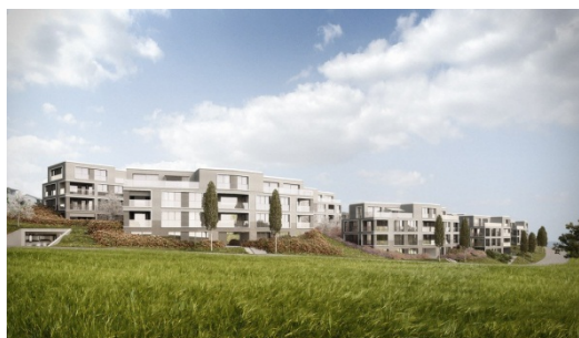
Sunshine Scenery, veduta esterna 1*