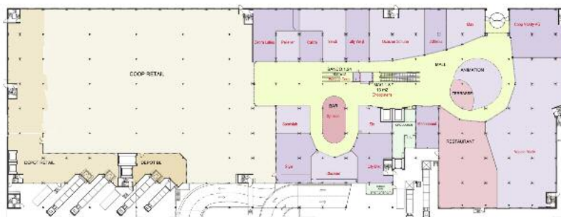
Plans du rez-de-chaussée et 1er étage