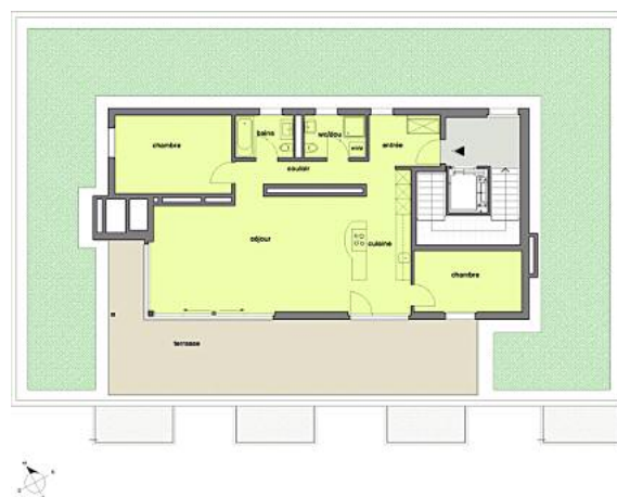
Plan de l'attique