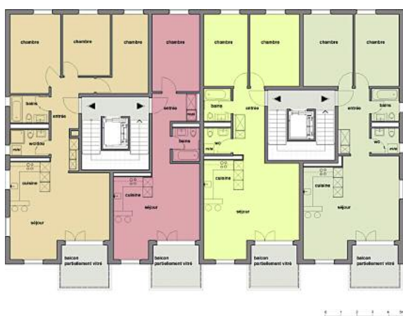
Plan du 3ème étage

Le parking de 93 places situé sous le groupe de cinq immeubles implanté au nord-est de la parcelle est relié à un deuxième parking plus petit (24 places) sous les deux immeubles implantés à l'est de la ferme. La toiture de ces garages souterrains est entièrement recouverte de terre végétale. Cette vaste surface verte se prolonge au sud-ouest par l'aménagement d'un parc se glisse entre l'arborisation existante, et se trouve sillonné par le cheminement piétonnier, et agrémenté de jeux pour enfants. Le jardin existant au nord-ouest de la ferme est laissé à l'état naturel et le petit parc baroque, au sud-ouest, restitué dans son esprit d'origine.