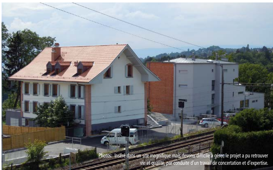
Photos: Inséré dans un site magnifique mais devenu difficile à gérer, le projet a pu retrouver vie et qualité, par conduite d'un travail de concertation et d'expertise.